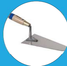
PETITS OUTILS DE CHANTIER